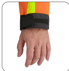
regulovaná manžeta nastavitelná manžeta adjustable cuff regulowany mankiet