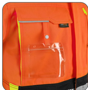
náprsní kapsa s odnímatelným pouzdrém ID karty náprsné vrecko s odnímatelným držiakom na ID kartu chest pocket with detachable ID card holder kieszeń na piersi z miejscem na ID kartę